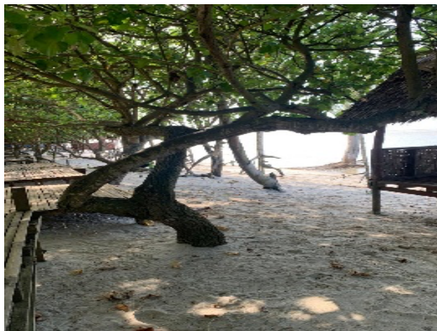
Gambar 1. Kondisi Ekowisata Mangrove Pantai Monyet

Pantai monyet berdiri tahun 2016 dan dinamakan pantai monyet karena pantai monyet ini identik dengan banyaknya monyet yang berkeliaran di pesisir pantai dengan jumlahnya cukup banyak, koloni koloni monyet memenuhi pantai sehingga masyarakat menyebut pantai tersebut dengan sebutan pantai monyet. Luas pantai monyet ini tidak hanya pantai saja dihitung akan tetapi pantai monyet mempunyai hutan mangrove dan apabila di hitung luar pantai mencapai 50 ha dan untuk luas mangrove ya sendiri itu 40 ha. Dan hebatnya luasan pantai monyet yang lebar ini di kelola oleh masyarakat secara swadaya.