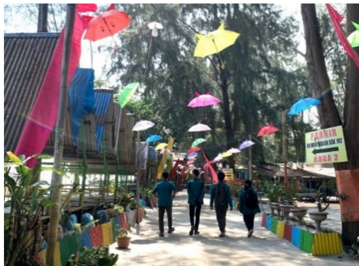
Gambar 2. Fasilitas Pada Ekowisata Mangrove Pantai Putra Deli

Mangrove di Desa Denai Kuala Kecamatan Pantai Labu Kabupaten Deli Serdang memiliki luasan wilayah \pm 350 Ha dan merupakan lahan yang dikelola oleh Penyuluh Kehutanan Swadaya Masyarakat (PKSM), dari total luasan 350 Ha tersebut ekowisata Pantai Putra Deli memiliki luas sekitar 40 Ha dengan luasan ekosistem Mangrove sekitar 35 Ha pada tahun 2020 menurut tutur dari ketua kelompok pengelola.