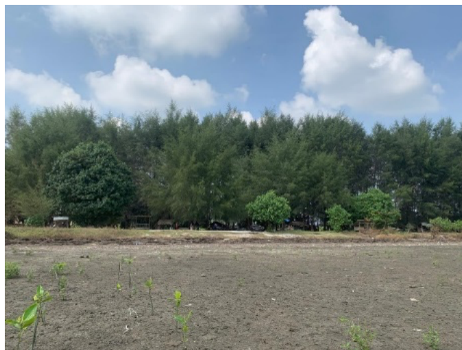
Gambar 5. Kondisi Mangrove pada Ekowisata Mangrove Pantai Muara Indah

Pantai Muara Indah terletak di Desa Denai Kuala yang masuk ke dalam wilayah administratif Kecamatan Pantai Labu. Pantai ini memiliki jarak sekitar 35 km dari pusat Kota Medan dan berjarak 50 km dari Lubuk Pakam. Pantai Muara Indah merupakan sebuah pantai ekowisata mangrove, Pantai Muara Indah terletak di sebelah timur dan berbatasan dengan kedua Pantai Ekowisata Mangrove lainnya yang terdapat di Desa Denai Kuala, Kecamatan Pantai Labu Kabupaten Deli Serdang.